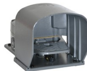
Wyłączniki jednopedałowe, z blokada pedału, z osłoną KR220