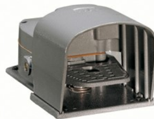
Wyłączniki jednopedałowe, swobodne uruchamianie, z osłoną KR200