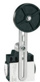
Dźwignia regulowana z rolką KNF