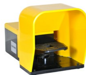
Wyłączniki jednopedałowe, swobodne uruchamianie, z osłoną KG200