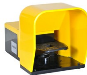
Wyłączniki jednopedałowe, swobodne uruchamianie, z osłoną KG200