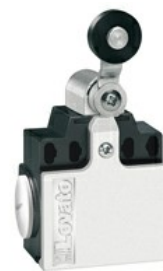
Dźwignia uchylna z rolką KCE