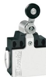
Dźwignia uchylna z rolką KCE