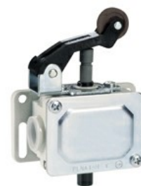
A leva con rotella centrale metallico PLN...H