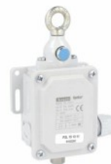
Finecorsa a fune con pulsante di riarmo P2L151311