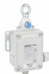
Finecorsa a fune con pulsante di riarmo P2L131311