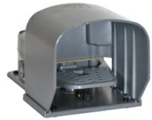
Interruttori a pedale singolo, con blocco a fondo corsa - Chiusa KR220