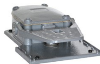
Interruttori a pedale singolo, con movimento libero - Aperta KR100