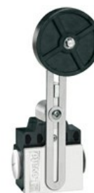
A leva regolabile con rotella KNF