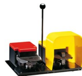
Pedali doppi, Pedale sinistro con movimento libero e pedale destro con leva di sicurezza - sinistro aperto e destro chiuso KGD003