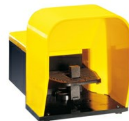
Interruttori a pedale singolo, con blocco a fondo corsa - Chiusa KG220