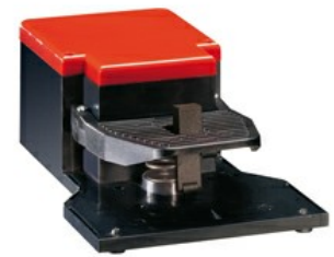
Interruttori a pedale singolo, con leva di sicurezza - Aperta KG110