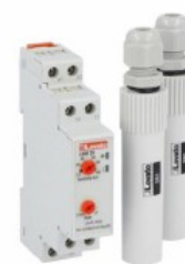
Przełącznik kontroli poziomu LVM25240 z zestawem 2 sond SN1 LVM25 Opróżnianie lub napełnianie