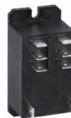
Relee intermediare ATEX HR802C