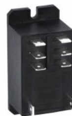
Relee intermediare ATEX HR802C