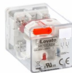
Przełączniki przemysłowe do gniazd 8-pinowych HR702C