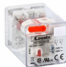
Przełączniki przemysłowe do gniazd 8-pinowych HR702C