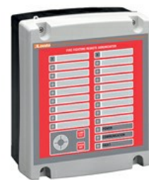
Panouri de alarma la distanta cu LED-uri si bezzet, pentru maxim 2 controlere de incendiu FFLRA200