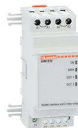
Module de extindere pentru produse modulare - Module de comunicare EXM1020