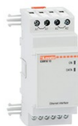
Module de extindere pentru produse încorporate - Module de comunicare EXM1013