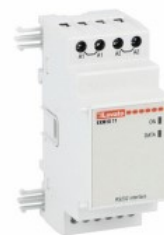
Module de extindere pentru prode modulare - Module de comunicare EXM1011