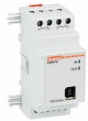
Module de extindere pentru produse modulare - Module de comunicare EXM1010