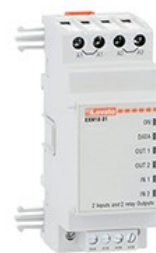
Module de extindere pentru produse modulare - intrări/ieșiri EXM1001