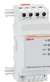
Moduły rozszerzeń do urządzeń modułowych – porty komunikacji EXM1020