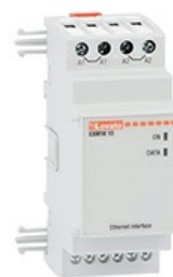
Moduły rozszerzeń do urządzeń tablicowych – porty komunikacji EXM1013