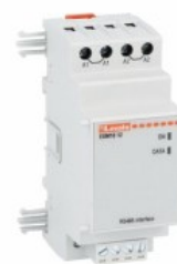
Moduły rozszerzeń do urządzeń modułowych – porty komunikacji EXM1012