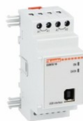
Moduły rozszerzeń do urządzeń modułowych – porty komunikacji EXM1010