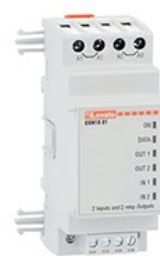
Moduły rozszerzeń do urządzeń modułowych – wejścia/wyjścia EXM1001