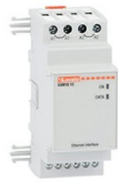
Moduli di espansione per prodotti da incasso - Moduli di comunicazione EXM1013