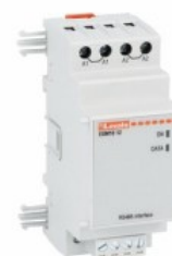
Moduli di espansione per prodotti modulari - Moduli di comunicazione EXM1012