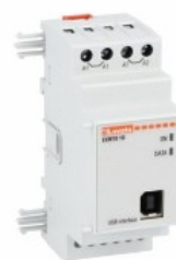
Moduli di espansione per prodotti modulari - Moduli di comunicazione EXM1010