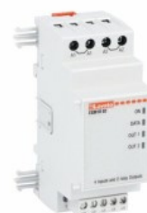
Moduli di espansione per prodotti modulari - ingressi / uscite EXM1002