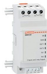
Moduli di espansione per prodotti modulari - ingressi / uscite EXM1001