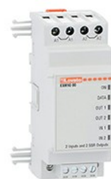
Moduli di espansione per prodotti modulari - ingressi / uscite EXM1000