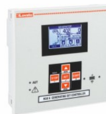
Controlere automate ale grupului electrogen de întrerupere a rețelei RGK610