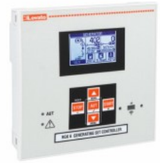
Sterowniki agregatu z funkcją kontroli parametrów sieci RGK600