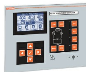
Controllori gruppo elettrogeno automatici per mancanza rete RGK700