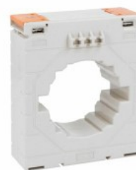
Transformatoare de curent DM35T0400