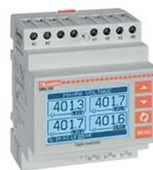
Mierniki modułowe z ekranem LCD, bez rozbudowy DMG200 3F + N 4