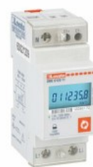
Contatori di energia monofase DMED120T1A120 Monofase 2