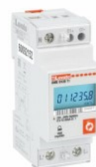
Contatori di energia monofase DMED120T1 Monofase 2