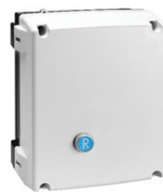
Starter direct M3R06512...B7

Denumirea produsului Denumirea tipului de produs