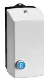
Starter direct M2R02510