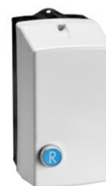
Rozrusznik bezpośredni M2R03210