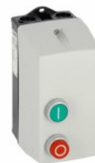
Rozrusznik bezpośredni M0P00910