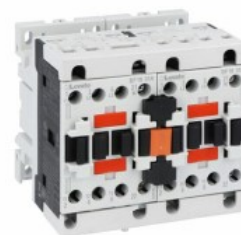
Styczniki w układzie nawrotnym BFA018